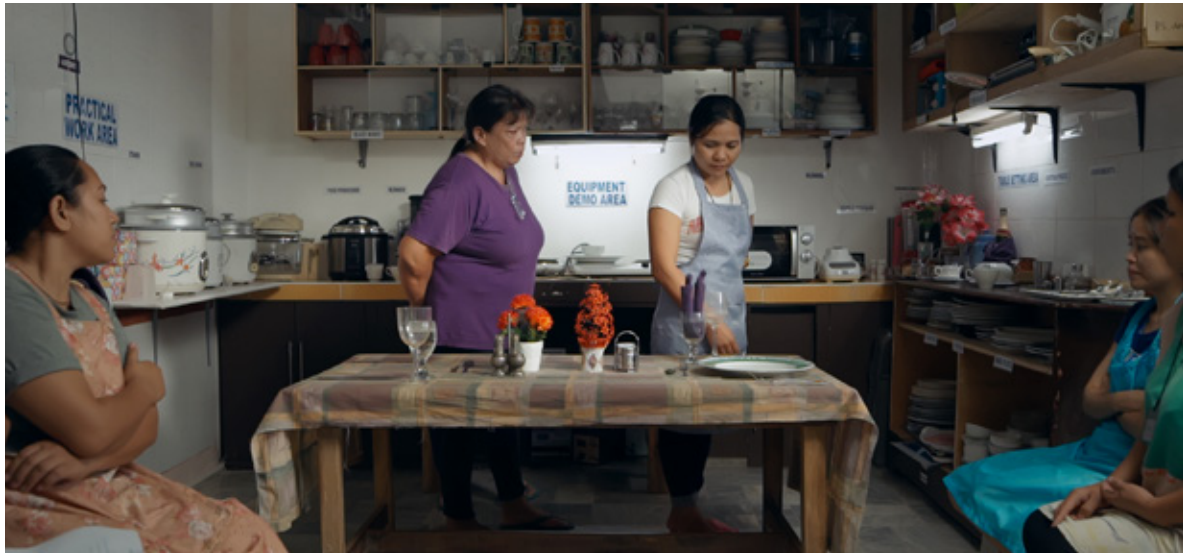
Overseas , de Sung-A Yoon, 2019

L'ouverture de la 21 e édition du Mois du film documentaire prend cette année une dimension hybride toute particulière. Le lancement se tiendra mardi 27 octobre dans plusieurs villes en France et dans le monde : à Paris (au Centre Pompidou), à Nîmes, à Tourcoing, à Reims et dans le réseau culturel des Instituts français et Alliances françaises à l'étranger.