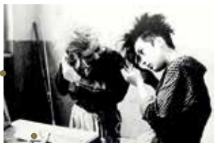
Winter Ade de Helke Misselwitz

Peut-on retracer, à travers sa production documentaire, l'effondrement d'un pays qui n'apparaît plus sur les cartes ? À l'occasion du 30 e anniversaire de la chute du mur de Berlin, tentative d'explorer ce qu'il reste de l'avant 89 et des espoirs de l'après, à travers une production rare et passionnante.