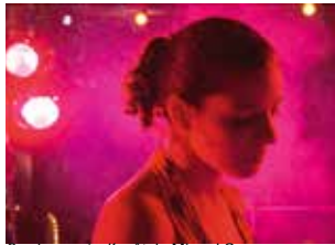
Ce cher mois d'août de Miguel Gomes