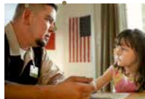
Of Men And War de Laurent Bécue-Renard