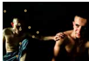
Pas comme des loups de Vincent Pouplard

Présentation et sensibilisation pratique à l'audiodescription via l'écoute comparative d'un même extrait décrit deux fois, suivi d'une "mise à l'épreuve" du public. Prévoir un carnet, un stylo et réviser ses cours de dessin!