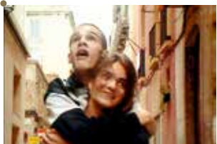
En Construcción de José Luis Guerin

Ou comment recréer de l'architecture avec de l'architecture existante : remettre en état, réorganiser et/ou accueillir de nouveaux usages, améliorer le confort et les performances énergétiques ; globalement, requalifier un bâtiment ou un ensemble. L'obsolescence de certains bâtiments (usines à l'heure de la désindustrialisation), ou l'arrivée à la fin d'un cycle de vie (architectures des Trente glorieuses, qui approchent