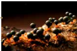
Planète Z de Momoko Seto