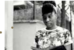
Nos défaites de Jean-Gabriel Périot

— Une exposition itinérante autour des séquences animées par Simone Massi issues du dernier film de Stefano Savona Samouni Road est proposée par la Galerie Miyu.