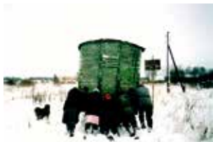
Le Jour du pain de Sergei Dvortsevoy