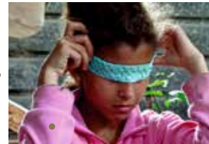
Samouni Road de Stefano Savona