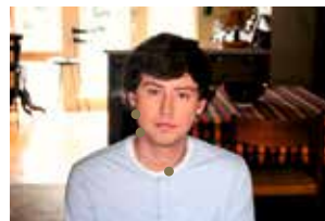
Coming out de Denis Parrot

Certains films par la force de leur regard sur l'environnement, les droits humains et la justice sociale inspirent pour changer le monde. Le Fipadoc les met en lumière sous le label Impact et facilite, avec ses partenaires, leur diffusion tout au long de l'année et sur tout le territoire.