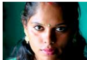
Guru, une famille hijra de L. Colson, A. Le Dauphin