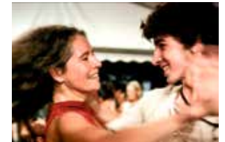
Le Grand bal de Laetitia Carton

« Je retiens la leçon des maîtres du cinéma des avants-gardes des années 1920 ou 1960-1970 : le cinéma peut, et doit, être un cinéma politique, et cela non uniquement par les sujets traités mais aussi par les formes cinématographiques utilisées. » Jean-Gabriel Périot Montage d'archives, fiction, reconstitution : au fil d'une trentaine de courts métrages et des trois longs, Jean-Gabriel Périot fait feu de toutes les formes qu'offre le cinéma pour explorer les thématiques qui reviennent dans tous ses films : la politique, l'histoire, la jeunesse, la violence.