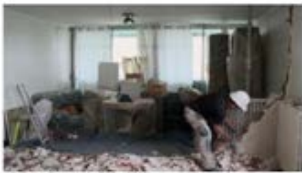
© Guillaume Meigneux / interland 2013 La réhabilitation de la tour Bois-le-Prêtre vue de l'intérieur

Réalisé par l'architecte Guillaume Meigneux, le film « HLM, Habitations Légèrement Modifiées », suit les habitants de la tour Bois-le-Prêtre (Paris, XVIIe) de 2009 à 2011, tout au long du chantier de réhabilitation du bâtiment. Un regard inédit à découvrir le jeudi 27 juin 2013 à 19h00 sur www.scam.fr . « Ils vont mettre un ascenseur dans ma cuisine, vous imaginez? Ils sont fous! » s'inquiète Madame C., 95 ans, à quelques semaines du début des travaux de rénovation de la tour Bois-le-Prêtre. Équière d'argent 2011 , la réhabilitation menée par les architectes Frédéric Druot, Anne Lacaton et Jean-Philippe Vassal, témoigne d'une métamorphose inédite en milieu habité. Pour réaliser ce documentaire, l'architecte Guillaume Meigneux est parti à la rencontre des habitants de la tour. Il les a suivis durant les deux années de ce chantier extraordinaire, pour saisir ce que signifie une telle transformation à l'échelle du quotidien.